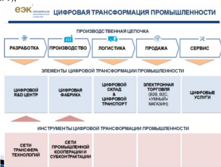
Рисунок 1 – Процессный подход