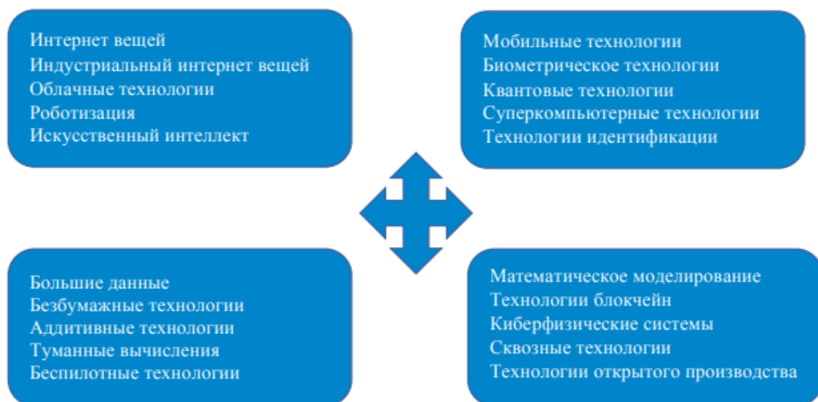
Рисунок 4 – Технологии цифровой трансформации экономики

- сформулировать возможные источники и технологии обработки, разработать рекомендации в форме алгоритма по использованию больших данных в цифровом маркетинге предприятия.