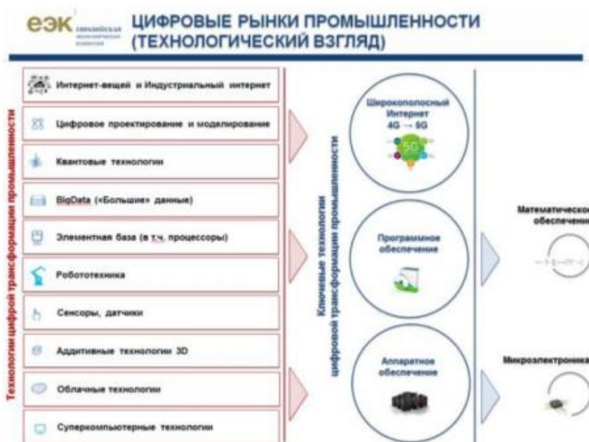
Рисунок 3 – Технологический подход

3) - уточнить используемые технологии в рамках технологического подхода (рисунок