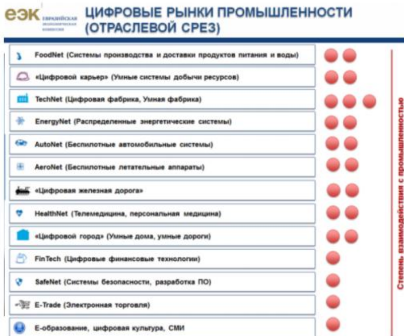
Рисунок 2 – Отраслевой подход

3) - уточнить используемые технологии в рамках технологического подхода (рисунок